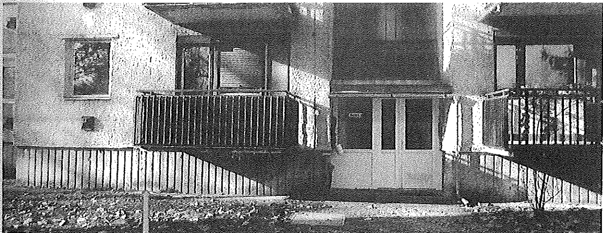
talapzat vizesedés nyomai

Maga az értékelt ingatlan a Jókai utca déli részén, társasházi lakóépületében helyezkedik el, a B lépcsőház magasföldszint 1-es szám alatt. Az épület előtti parkosított terület külső szemlélés alapján jó esztétikai benyomást kelt. Maga a 3 emeletes épület erkélyes lakásokkal, kedvező benapozással, jó kilátást biztosít az ott lakók részére. Az épület külső szemlélése során megállapítható azonban az épület lábzatának vizesedése, ami a szigetelés hiányosságaira utal.